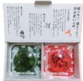
2点セット 〈鶴・亀〉 2,500円(税別)