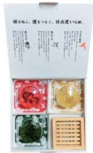
4点セット 〈鳳凰・鶴・亀・石鹸置き〉 5,250円(税別)

各セットの商品は他の組み合わせも可能です。組み合わせ内容により価格は変わります。