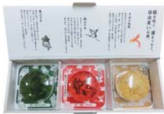
3点セット 〈鳳凰・鶴・亀〉 4,150円(税別)